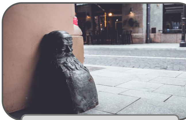
1897 m. nykštukas saugo, kad transporto priemonės nenudaužytų namo kampų